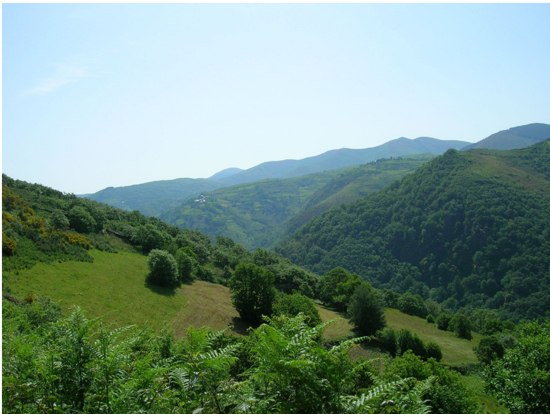
Sierra del Courel.

Geoparque Mundial de la UNESCO Montañas do Courel , al sur de la provincia de Lugo. Recepción por parte de las autoridades del Geoparque en el Museo Xeolóxico (y Paleontolóxico) de Quiroga , visita a un yacimiento de graptolitos silúricos, almuerzo típico gallego y despedida en el mirador geológico del gran pliegue tumbado de Campodola-Leixazós. Las plazas para asistir a la salida de campo serán limitadas y se adjudicarán por riguroso orden de inscripción.